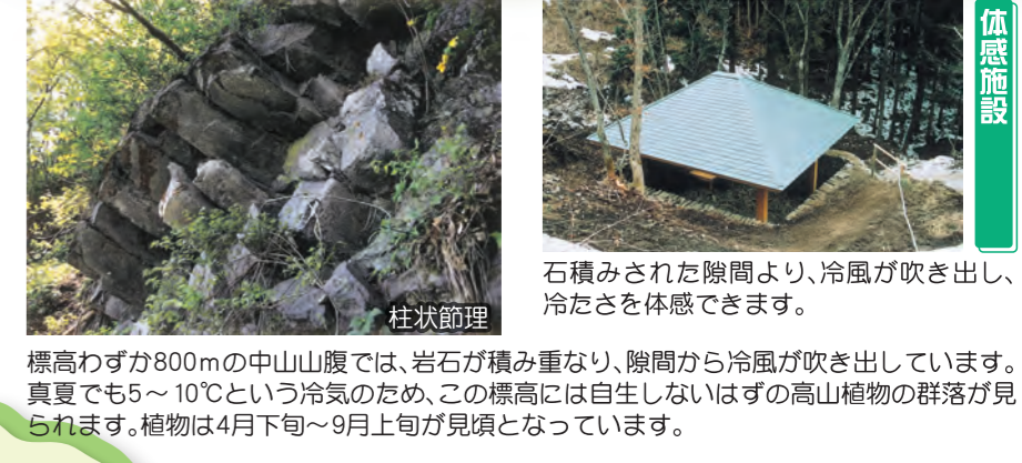
標高わずから800mの中山山腹では、岩石が積み重なり、隙間から冷風が吹き出しています。真夏でも5~10℃という冷気のため、この標高には自生しないはずの高山植物の群落が見られます。植物は4月下旬~9月上旬が見頃となっています。

下郷町産物館まちの駅 塔のへつり入口近くの国道121号沿いにあり、竹細工などの民芸品や工芸品も豊富です。緑と四季の産物が豊富な下郷町の野菜・果物・花・山菜・きのこなど、新鮮なものがばりです。