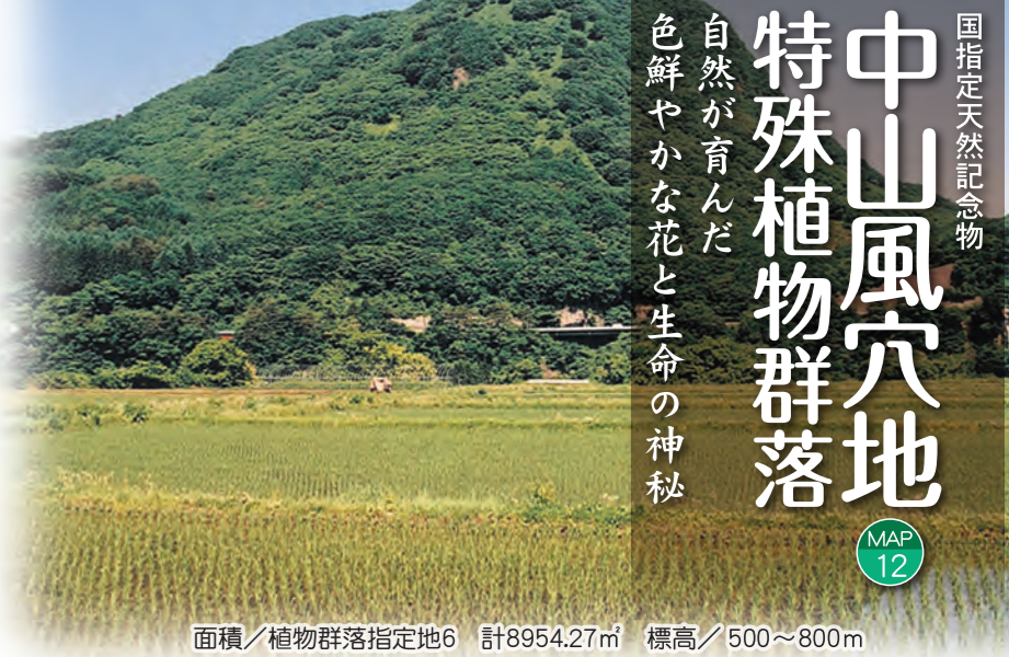
面積/植物群落指定地6 計8954.27㎡ 標高/500~800m