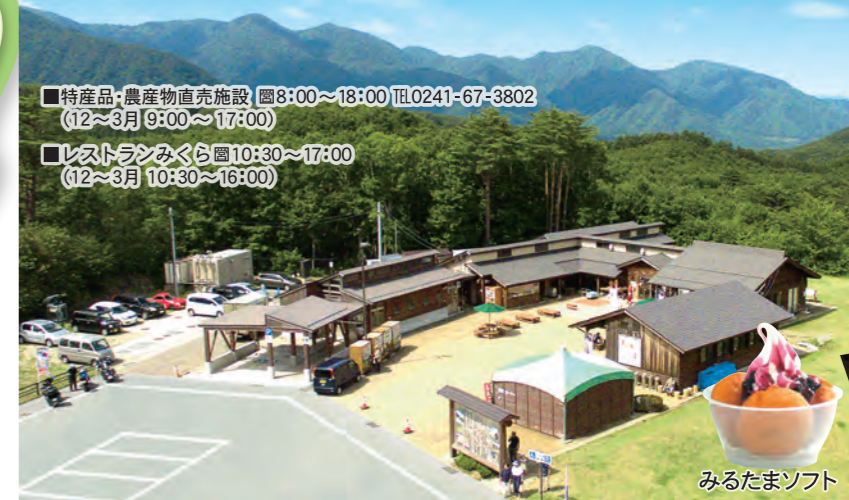
「道の駅しもごう」は、地域の農産物直売や、手工芸品などが魅力的です。「レストランみくら」では、猿楽台産そば粉使用の手打そばが大好評。「テイクアウトコーナー」では、ジャージー牛の生乳・会津地鶏卵を使用したドーナツに、生乳を多量に使用したソフトクリームをのせ、地元産ブルーベリーソース(手作り)をかけた「みるたまソフト」は濃厚な味で大人気です。